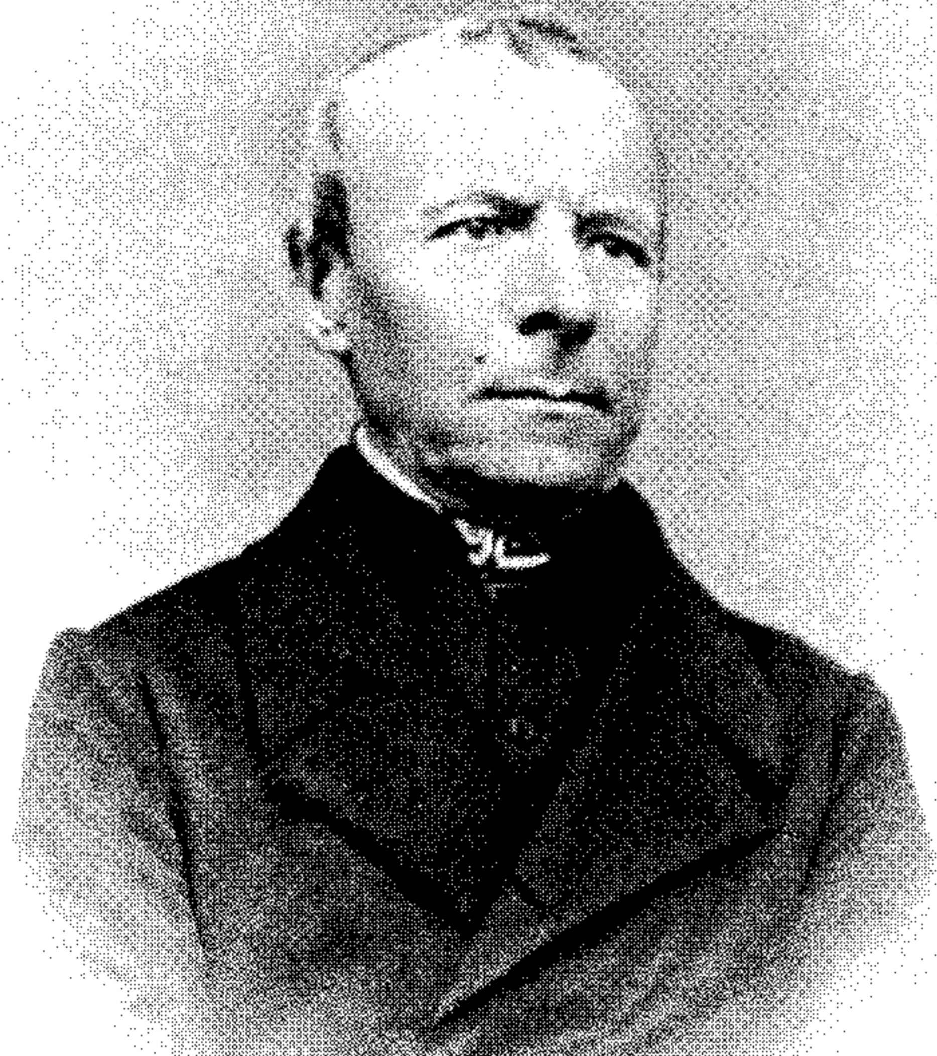
František Sušil dva roky před smrtí.